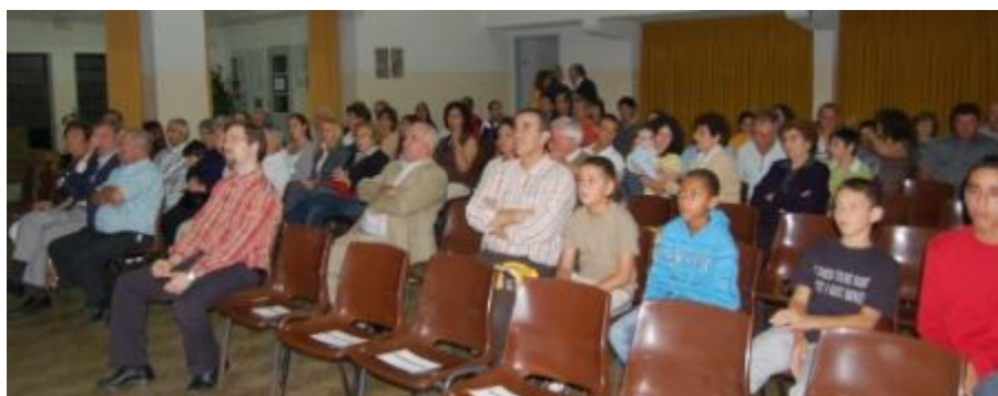
Sala cheia na sessão solene, comemorativa dos 73 anos do Mem Martins Sport Clube

“Os 22 mil dirigentes voluntário no país, têm um papel muito importante para o desenvolviment o da sociedade”, apelando à Assembleia da República, a necessidade da “criação de legislação que permita criar condições para o desenvolvimento desportivo e cultural das associações no país”.