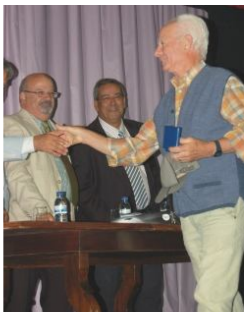
Sócio com 50 anos de associado